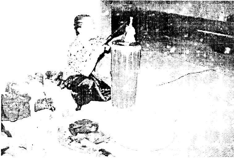
Sumber: Kajian lapangan