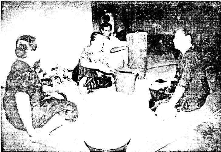
Gambar 1: Proses Sinasadan iaitu membuat tapai dalam ritual Monogit .

Kebiasaannya, ritual Monogit dilakukan selama 3 hari 2 malam. Namun jangka masanya adalah berubah-ubah, mengikut kesesuaian masa dan kesenangan bagi keluarga menjalankan ritual ini yang boleh dibahagikan kepada empat bahagian iaitu Kotudungan bererti permulaan ritual sebagai bahagian pertama, Mamasa'an bererti memakai pada hari kedua yang merupakan bahagian kedua, Kinapangazan bererti hari penutup atau hari ketiga sebagai bahagian ketiga dan Pa'atod Hangod bererti menghantar Sembah pada hari keempat yang merupakan bahagian keempat iaitu bahagian terakhir. 34